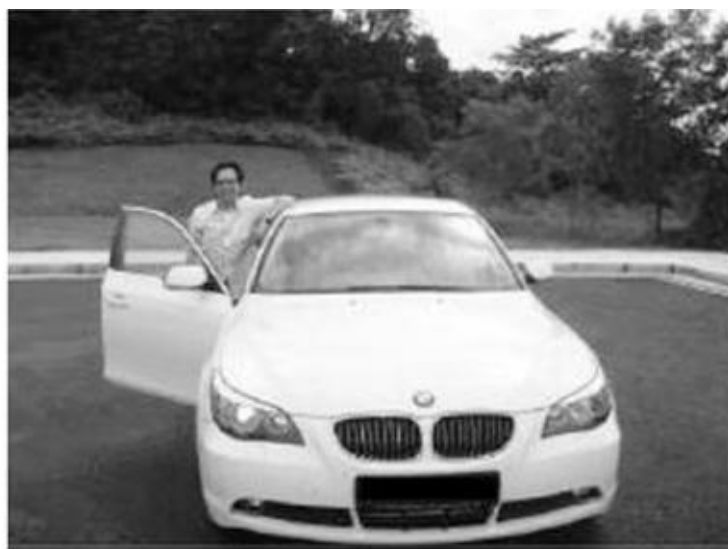
Tôi và chiếc xe BMW 523i của mình

Chúng tôi đã có cơ hội đi thăm trường quay Universal Studios ở Hollywood năm ngoái, khi tôi